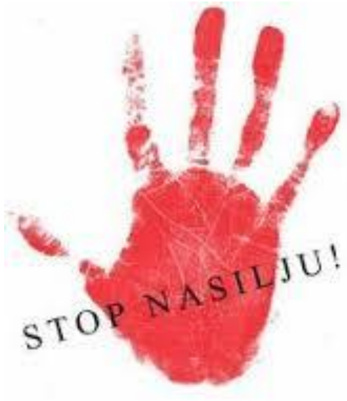
Slika 14. Stop nasilju

https://www.facebook.com/video.php?v=683931111665189&set=vb.673738549351112&type=2&theater