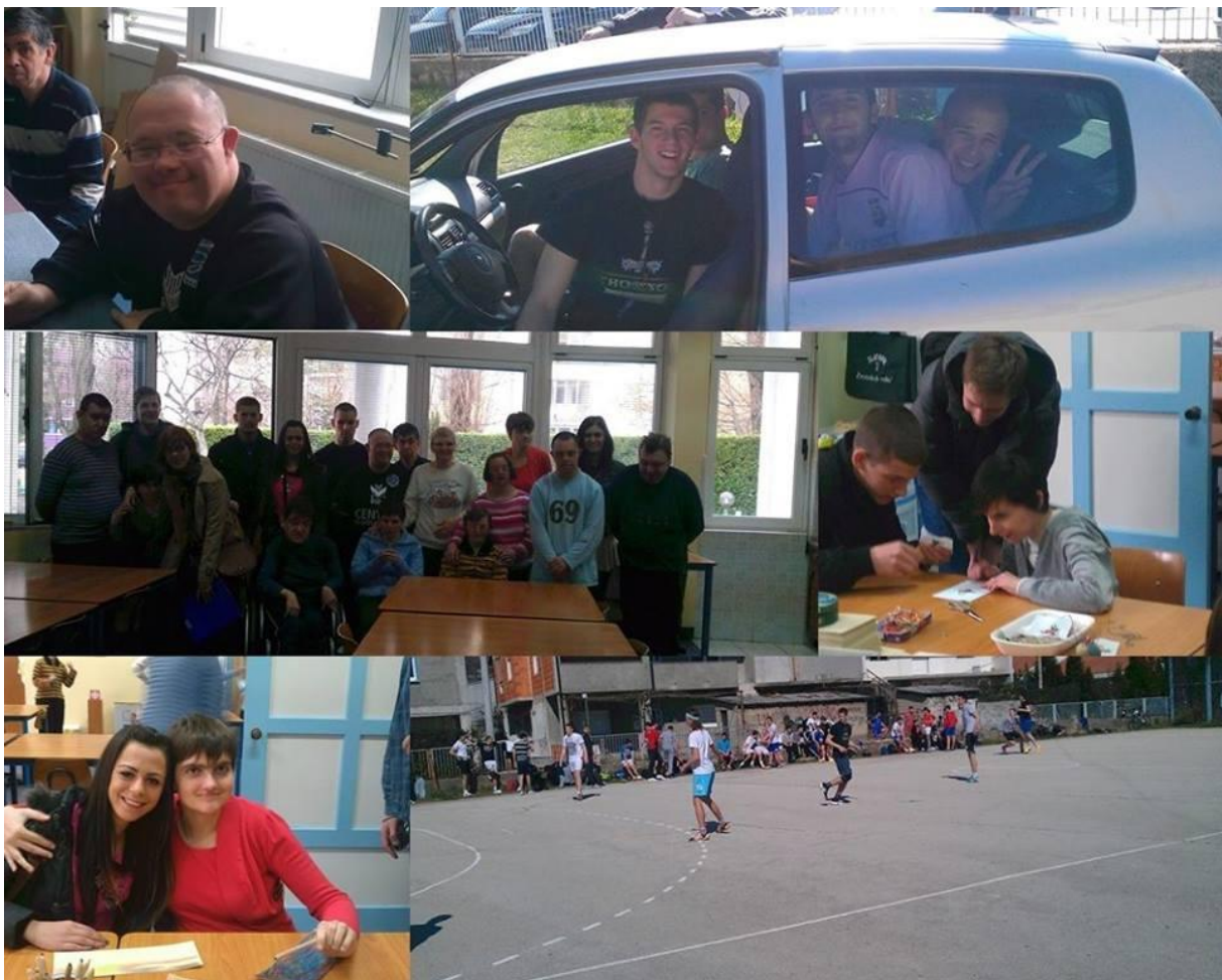
Slika 7. Turnir solidarnosti za Nazaret

Kratak opis akcije: Organizovan je humanitarni turnir u malom nogometu za osobe s posebnim potrebama u Nazaretu. Na turniru su sudjelovali svi razredi srednje Strojarske škole, a pobjednici su nagrađeni oslobađanjem od nastave. Prikupljeni novac je odniet u Nazaret, gdje je organizovano i prigodno druženje.