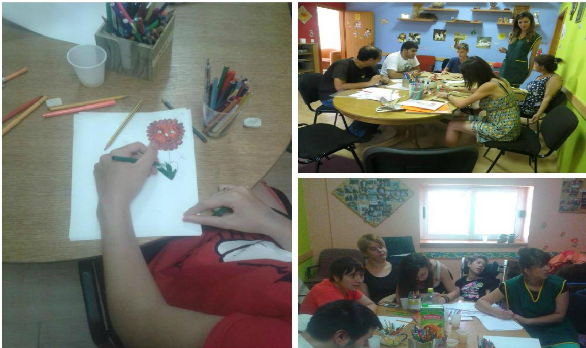
Slika 16. Nađi vremena za pomaganje drugima, dan je prekratak da bi bio sebičan

https://www.facebook.com/video.php?v=683921274999506&set=vb.673738549351112&type=2&theater