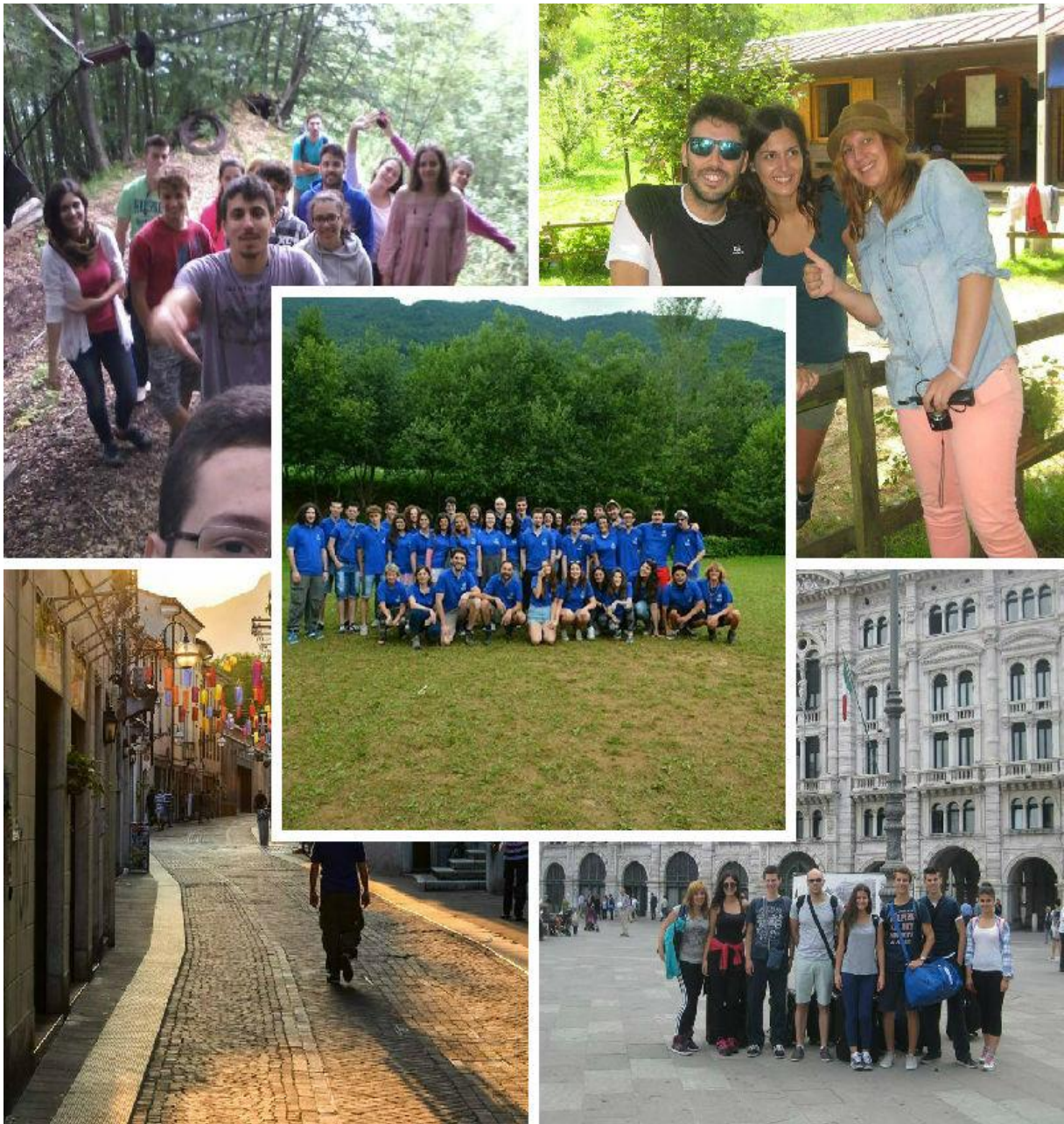
Slika 18. Najbolji volonteri uživaju u Italiji