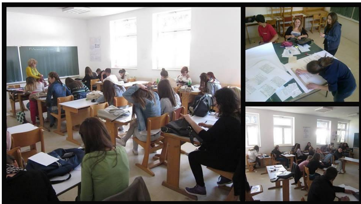
Slika 2. Svi smo jednaki

Posebna vrijednost: Više od 150 učenika je imalo priliku slušati radionice na kojima su naučili da se djeca s poteškoćama u razvoju ne razlikuju od drugih.