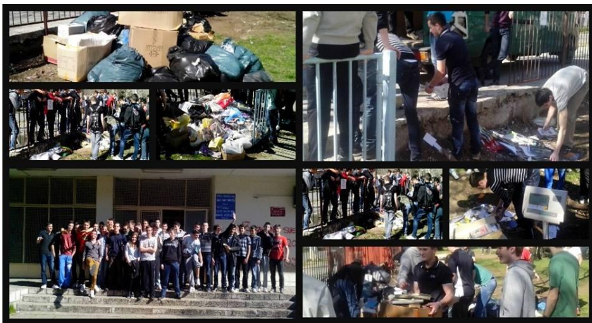
Slika 10. Liga papira

Kratak opis akcije: Srednja elektrotehnička škola Ruđera Boškovića realizovala je akciju sakupljanja papira pod nazivom "Liga papira". Akcija je održana dana 20.3.2014. u prostorijama škole. Akcija je bila jako uspješna, prikupljena je velika količina papira za recikliranje. Novac koji je sakupljen od recikliranog papira bit će iskorišten za obnavljanje prostorija škole.