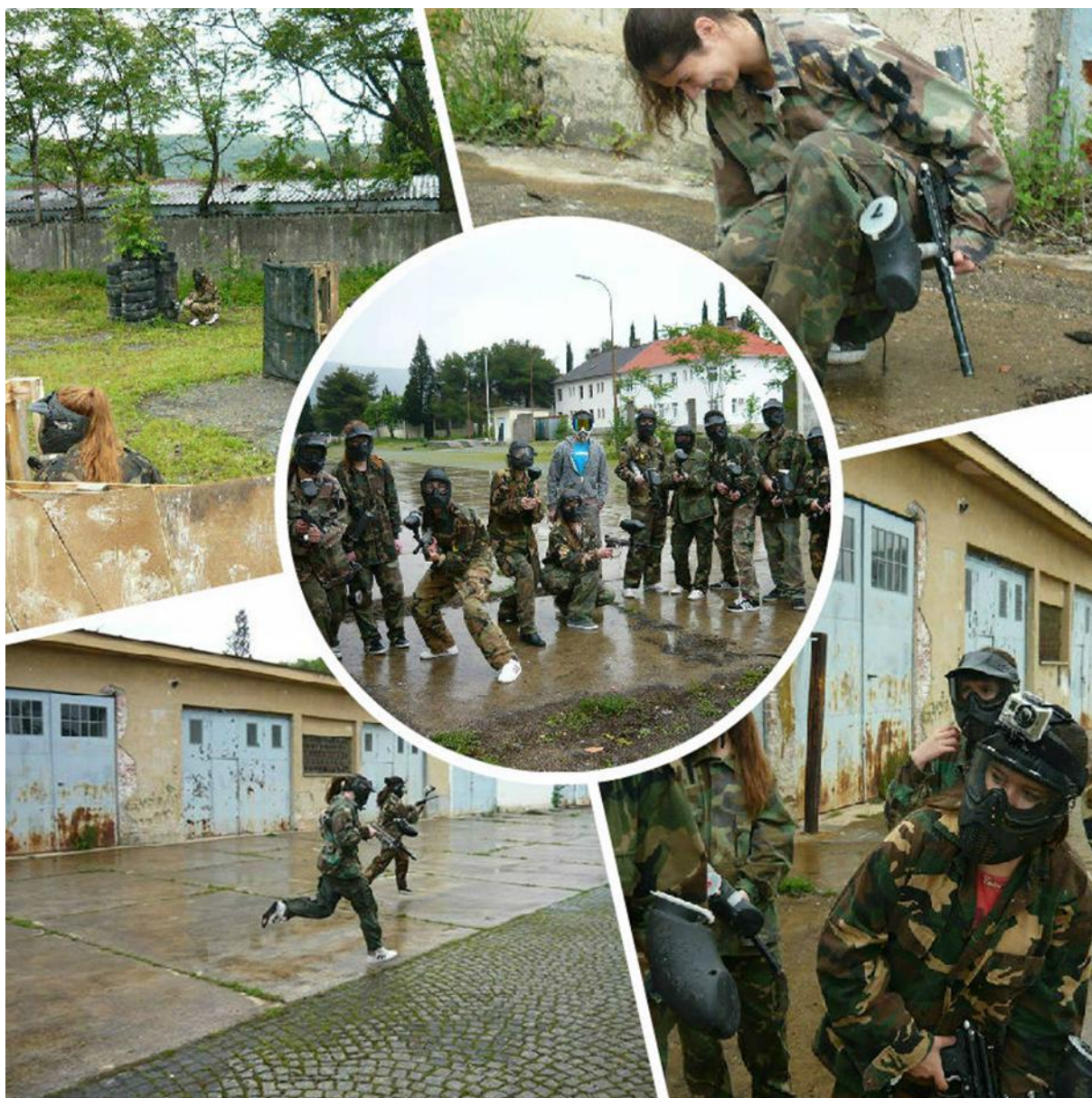
Slika 17. Volonteri najbolje proglašene akcije se zabavljaju u panitball klubu