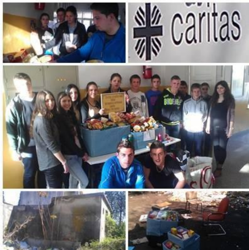
Slika 9. I mali dar, velika je stvar

Kratak opis akcije: Srednja prometna škola Mostar je pod vodstvom članova Vijeća učenika u periodu od 17.03. do 31.03. 2014. godine organizirala akciju za prikupljanje humanitarne pomoći beskućnicima i socijalno ugroženim obiteljima u vidu trajnih prehrambenih proizvoda i namirnica (ulje, šećer, brašno, konzervirani proizvodi i slično). Uz prehrambene namirnice mogla se donirati odjeća i obuća u očuvanom stanju. Prikupljene namirnice, odjeću i obuću donirani smo na raznim mjestima. Cilj je potaknuti druge na humanost i nesebičnost kako bi nekim osobama uljepšali život i vratili osmjeh na lice.