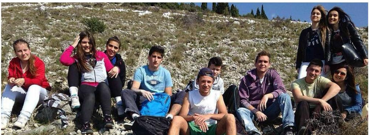
Slika 15. BiH volimo te