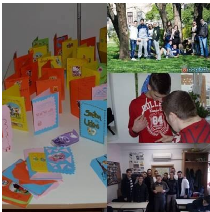
Slika 3. People help the people

Posebna vrijednost: Pravljenje čestitki sa djecom sa posebnim potrebama, tako da su i oni neizmjerljivo pomogli u našoj akciji prikupljanja sredstava za njihovo lakše obrazovanje.