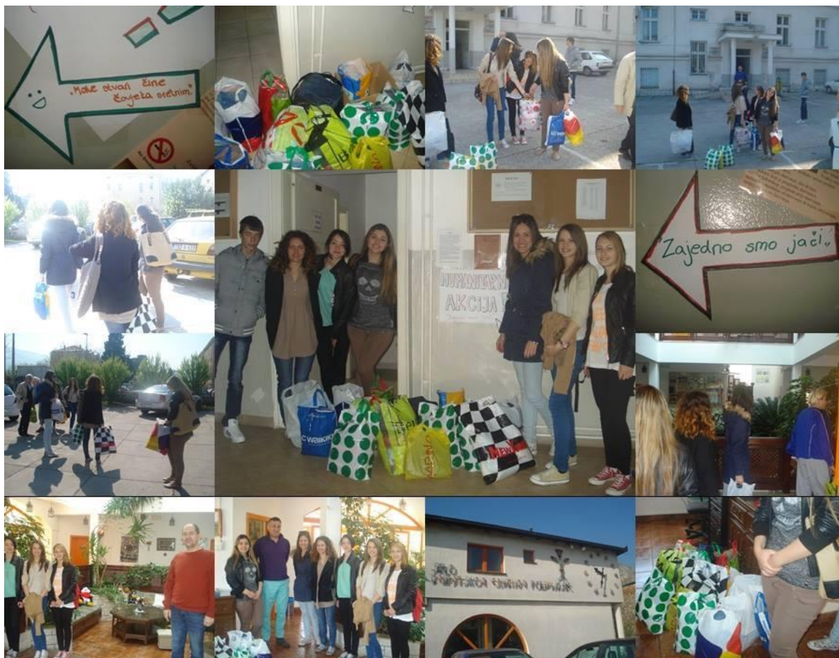
Slika 5. Zajedno smo jači

Kratak opis akcije: Pokrenuta je volonterska akcija "Zajedno smo jači", s ciljem prikupljanja odjeće, obuće, školskog pribora, te stvari za koje smatrate da su nebitne, a nekom ipak znače mnogo. Akcija je trajala od 26.3 do 28.3.2014.g. Sredstva skupljena u ovoj akciji su donirana za djecu bez roditeljskog staranja u "Egipatskom selu". U cjelokupnoj akciji učestvovali su svi učenici škole, dok je volontersku akciju organizovalo pet volontera.