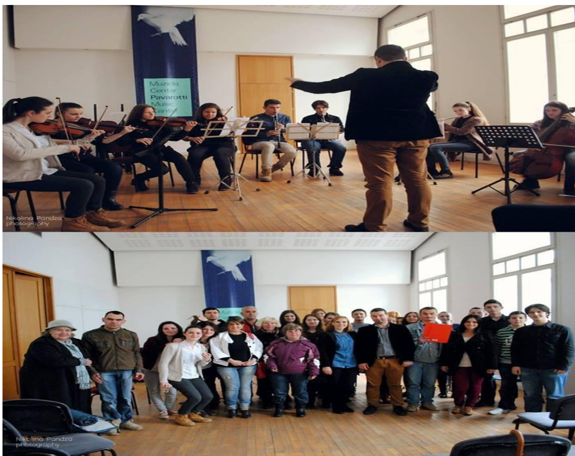
Slika 4. Interna priredba za osobe s posebnim potrebama

Kratak opis akcije: Članovi Vijeća učenika Muzičke škola I i II stupnja Mostar su došli na ideju da provedu barem jedno popodne s osobama s posebnim potrebama družeći se, te su organizirali koncert za korisnike Udruženja "Sunce". Na koncertu su učestvovali, osim učenika Muzičke škole, i korisnici Udruženja Sunce, čije su izvedbe zaista oduševile sve prisutne. Druženje je upotpunjeno zakuskom, gdje je nastavljeno u atmosferi za poželjeti.