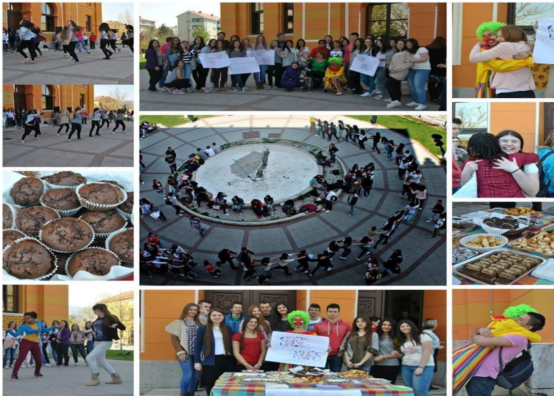
Slika 6. Podijelimo sreću

Kratak opis akcije: Vijeće učenika je imalo želju uraditi volontersku akciju humanitarnog karaktera. U tjednu od 24. do 31. ožujka prikupljala se odjeću koju su učenici donosili. Ta odjeću donirana Udruženju Sunce i Egipatskom selu. Dana 31. ožujka, održao se vrhunac volonterske akcije. Učenici gimnazije podijelili su sreću, tako što smo umjesto dva sata nastave proveli dva sata ispred škole u društvu kolega i prijatelja, jedući kolače (koje su sami napravili), opuštajući se uz plesne točke i veselu glazbu, te uživajući u „besplatnim zagrljajima“ koje su dijelili članovi vijeća. Najveće zadovoljstvo izazvali su štice Udruženja Sunce, koji su ovu akciju uveličali svojim dolaskom.