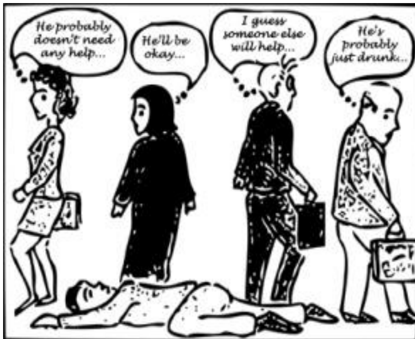
Slika 12. Oš' mi pomoć ? Neću ja..on će !

https://www.youtube.com/watch?v=fNCPXUWYgrQ&feature=youtu.be&fb_source=message