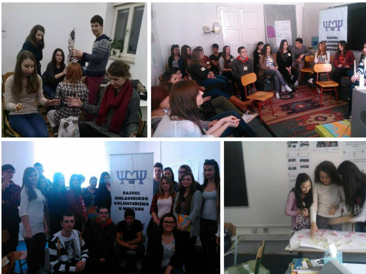
Slika 1. Planiranje i pripremanje volonterskih akcija

Ubrzo, učenici su postali i učitelji. 376 učesnika radionica je prenijelo znanje o građanskom aktivizmu i volonterizmu svojim kolegama iz razreda, te je pokrenuto planiranje volonterske inicijative u svakoj školi.