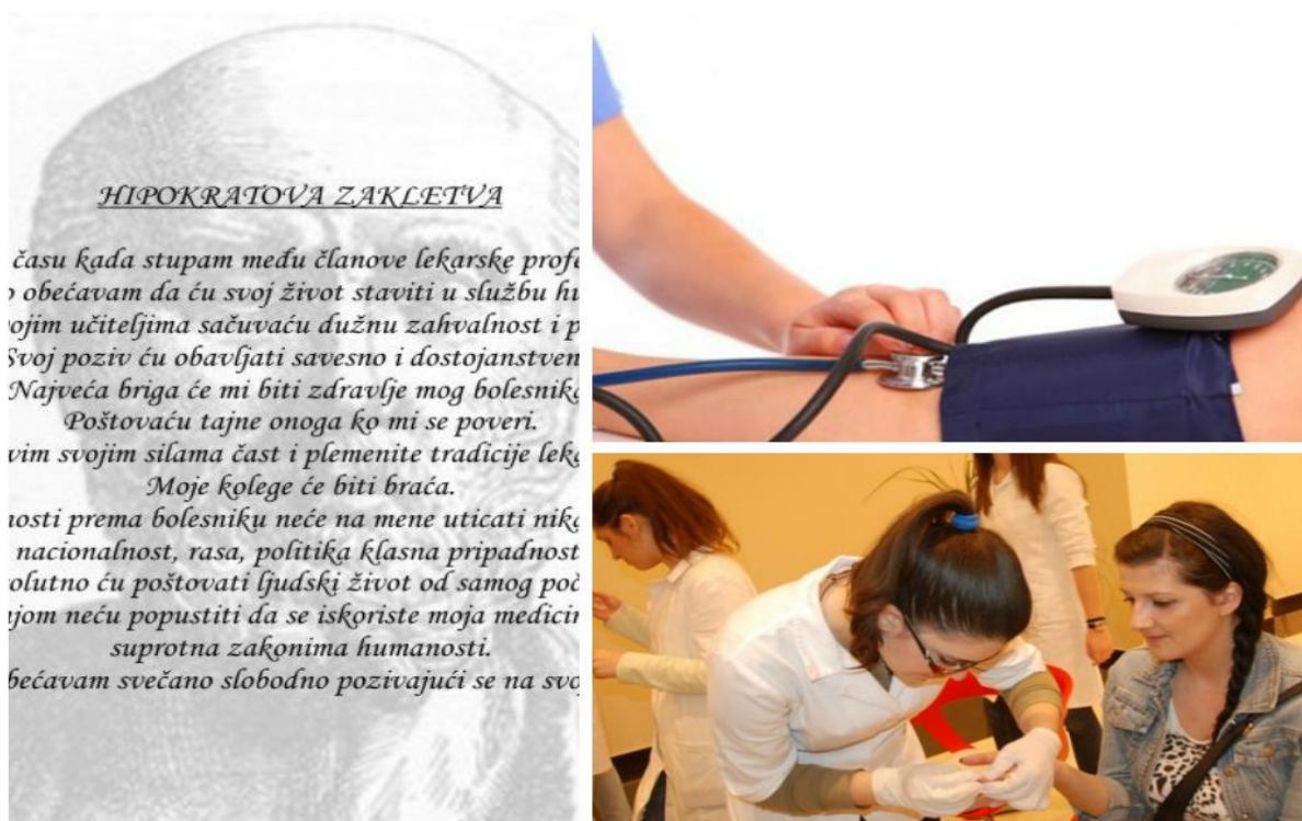
Slika 11. Mi smo bolja i zdravija budućnost

Opis akcije: 29.3.2014. učenici SMŠSM u Mepas Mall-u održali su akciju koja je imala za cilj upozoriti građane Mostara o važnosti brige za vlastito zdravlje. Građani su imali priliku izmjeriti tlak, nivo šećera u krvi, dobiti masažu lica, te kupiti balzame napravljene od strane učenika, kao i dati dobrovoljni prilog za Centar za stara i iznemogla lica. Pored toga, napravljen je video s ciljem da se upozori na često zanemarivanje Hipokratove zakletve od strane onih koji je polažu. Video isječak sa akcije možete pogledati na link adresi: https://www.facebook.com/video.php?v=685118424879791&set=vb.673738549351112&type=2&theater