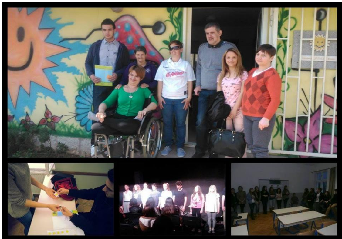
Slika 8. Humanitarna akcija

Kratak opis akcije: Učenici Srednje ekonomske i turističko - ugostiteljske škole realizovali su akciju prikupljanja novčanih sredstava za pomoć Udruženju "Sunce" Mostar koje se zalaže za poboljšanje kvalitete života osoba sa posebnim potrebama. Prikupljen je određeni iznos novca od prodanih ulaznica za predstavu "Nije Šekspir, ali jeste Romeo i Julija" u Teatru Mladih u Mostaru i prodajom markica u školi.