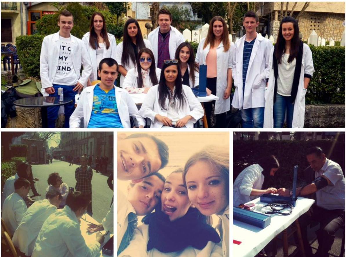
Slika 13. Vratio sam se živote

Kratak opis akcije: Učenici Srednje medicinske škole organizovali su volontersku akciju pod nazivom „Vratio sam se živote“, usmjerenu na podizanje svijesti o prevencije i zaštiti zdravlja. Građani su dobili priliku za mjerenje krvnog pritiska u cilju prevencije povišenog krvnog pritiska. Akcija je održana 19.03.2014 u ulici Fejićeva bb. Slide show sa volonterske akcije možete pogledati na link adresi: http://slide.ly/view/863171a924de189c9320be3484b87a4c